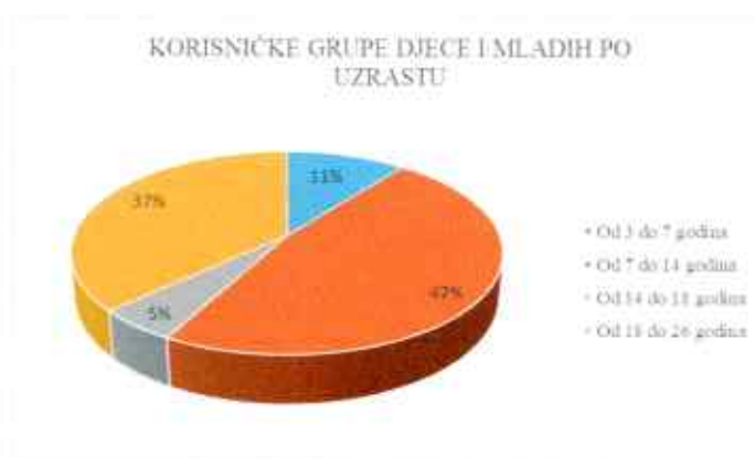
Grafikon 1. Korisničke grupe prema uzrastu